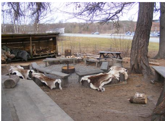
13. kép: Szabadtéri tűzrakó hely rénszarvasprémekkel

A második általunk felkeresett barnehage, igazi unikum volt a számunkra. Az intézményben minden évszakban, időjárástól függetlenül egész nap kint vannak a gyermekek a szabadlevegőn. A óvoda maga az erdei környezetben található nagy udvar és néhány kiszolgáló helység. A barnehage egyik végében található egy ponyvával borított sátor, ami a hideg ellen nyújt védelmet napközben a gyermekeknek és a felnőtteknek igény szerint. A sátor közepén egy zárt kályha adja a meleget, amely ez esetben is körbeülhető. A sátorba betérve és melegedve a gyermekek nap, mint nap megtapasztalják a tűz jelentőségét az ember életében. De a melegedésnek, beszélgetésnek és mesének a helye a szabadban is megtalálható. A tűzrakás és tűzgyújtás ceremóniája ebben az intézményben is mindennapos, és a tevékenységben a kicsik itt is aktív segítők. Amikor a tűz már lobog együtt a rénszarvasbőrökre telepednek, esznek, beszélgetnek, mesét hallgatnak.