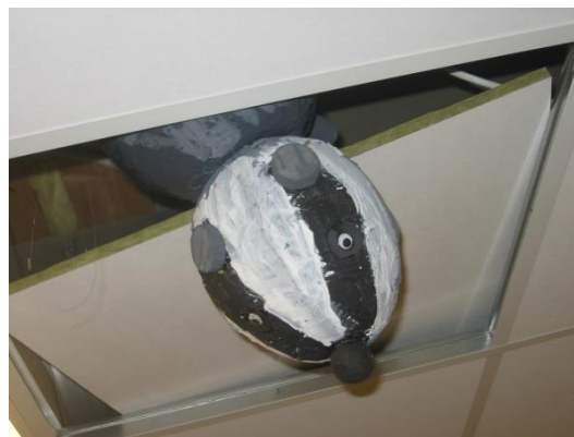
7. kép: Borz projekt