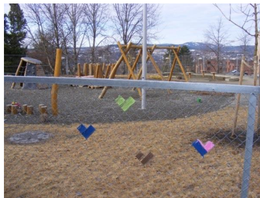
22. kép: Játszótér az udvaron