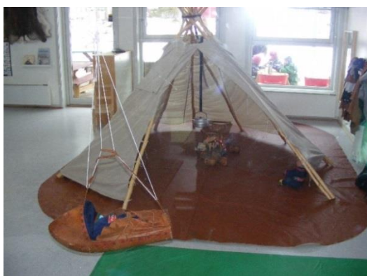
17. kép: Számi sátor a csoportszobában

Norvégiában, hogy támogassák a számik életformáját, a számik kizárólagosságot élveznek a rénszarvas-tenyésztésben. Az életformájuk azonban mára már jelentős mértékben modernizálódott. A hagyományos rénszarvastartás és tenyésztés jól felszerelt farmgazdaságokban, motoros szánokkal és terepjárók segítségével történik, a húsipari célok érdekében. Ugyanakkor a számik az országok között szabadon átjáró rénszarvastartáshoz tartozó vándorló életmódja nem változott. A barnehage-ban a számik természettel való együttélésének, a mindennapi élet és a hagyományok óvodai játékban való megjelenését a csoportszobában kialakított számi sátor, az eszközök, a falakon elhelyezett zászló, és a számi ruházatot és hagyományokat bemutató képek sora segítette.