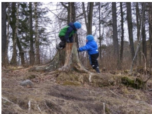
15. kép: Jó játék fatuskóra mászás

tervezésének és kivitelezésének tudományát a barnehage-ban dolgozó szakképzett nevelők hallgatóként a Dronning Mauds Minne – Høgskolen/Queen Maud University College-ban sajátítják el egy fél éves kurzus keretében, és ezt a tudást kamatoztatják a gyakorlatban.