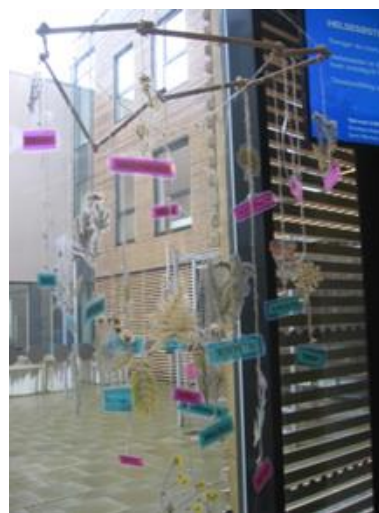
2. kép: Újrahasznosítással készült dekorációk

Az udvaron szembetűnő, hogy sokan kerékpárral érkeznek (3. kép). Ez a közlekedési mód jellemző a városban közlekedésre is. A szülők gyermekeiket is kerékpárral, illetve a kerékpár után akasztható kis kocsival szállítják. A közösségi közlekedés is rendkívül szerteágazó, jól követhető és megfizethető.