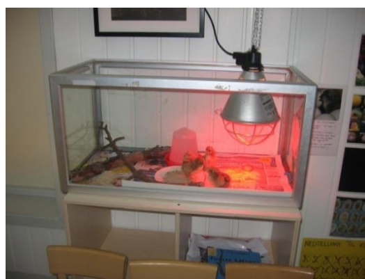
6. kép: Kelnek a kicsibék az óvodában

Tanulmányutunk hétvégi programja a tenger melletti ösvény felfedezése volt. Esett az eső, mint sokszor Trondheimben, így mi is az időjáráshoz öltözve vágtunk neki a felfedezésnek. Dél előtt 10 órára megtelt a sétaút gyerekes családokkal, futó, gyors gyalogló és sétáló felnőttekkel. A gyerekek, mint az óvodákban, itt is „vizeztek”. Nem rettentette el őket sem a szél, sem a +2 °C. Örömmel láttuk, hogy a gyerekek mellett főként édesapák voltak,