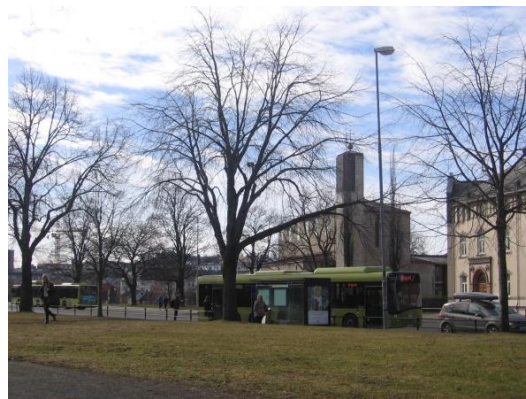
3. kép: Környezetbarát közlekedés Trondheimben

Tudtuk, hogy Norvégiában a társadalom bizalom alapú, régi hagyománya van a demokráciának – és ezt minden programunknál tapasztaltuk is. Utunk során megtapasztalhattuk, amit már olvastunk, hogy Norvégia 10%-a bevándorló, így szó szerint színesek az emberek. Nem véletlen tehát, hogy a társadalmi fenntarthatóságra nevelés hangsúlyos náluk, vagyis napjaink társadalmi és világ problémáira igyekeznek reagálni. Élményeink és tapasztalataink alapján leírhatjuk, hogy Norvégia láthatóan, érezhetően egy jól működő társadalom, amelynek egyik titka talán az lehet, hogy Norvégiában az értékek, kultúrák és egyéniségek különbözőségét lehetőségként kezelik, s ez érezhető a nevelési és oktatási célokban is. Legszembetűnőbb már érkezésünkkor az volt, hogy mindenhol kisgyermekes anyákat, apákat láthattunk, vidám, kiegyensúlyozott és érdeklődő gyermekekkel. Élték mindennapjaikat, aktív és hasznos részei voltak a napi tevékenységeknek, a mindennapi életnek. Az utcákon, a mindennapi élet során is érezhető volt a nyitottság és a bizalom.