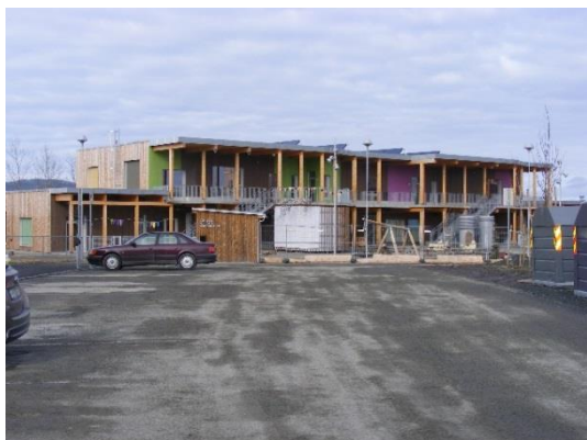
21. kép: Az új öko-óvoda

modern, új építésű, a játszótér a gyermeki mozgásfejlődést segíti. Az udvaron a gyermekek szabadon játszhatnak, és a gyermeki fantázia és kreativitás itt is szárnyal, hisz a modern drótkerítés akár lehet egy óriási szövöszék is, amelyre kis fonalszívek szőhetők.