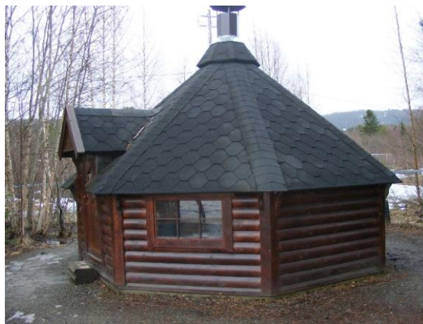
11. kép: Fából készült melegedőhely az udvaron

A barnahage-ban rendszeresek a kirándulások. Fontos számukra a természeti és épített környezet megismertetése, megszerettetése, a természettel való kapcsolat sokoldalú erősítése, és az edzettség, amelynek elérése egyaránt cél. Az egészség fontos, a nevelők elmondása szerint a betegség ritka a gyermekek körében.