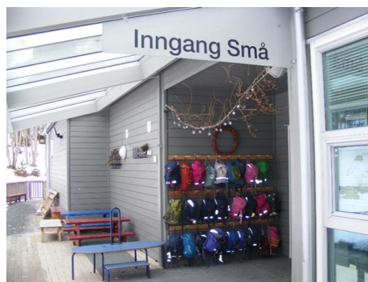
20. kép: Útrakész hátizsákok

A kirándulások minden évszakban rendszeresek, természetesek. A gyermekek az időjárástól függetlenül mennek az erdőbe. A kirándulások alkalmával ismerkednek a növény és állatvilággal, az erdei ökoszisztémával. Ha a séták alkalmával valami érdekes dolgot találnak, például madárfészket beviszik az óvodába és ott egy üveges szekrénybe helyezve napokig még foglalkoznak vele, beszélgetnek róla.