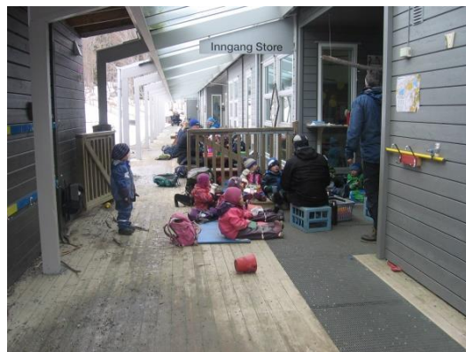
4. kép: Szabadban étkező óvodai csoport