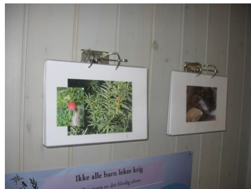
8. kép: Kisegér flakonból – díszlet; ...és amit tudni kell a növényekről

Óvodáikban főként gyermekmunka díszítette a falakat. Témaként az évszak, annak jellemzői és egy-egy, a projekt-témának megfelelő vizuális, plasztikus munka volt jellemző (8. kép). Ezen munkafolyamatok a gyermekek kedve, érdeklődése szerint helyezkedtek el a mindennapokban. A technikai megoldást is a gyerekek eszközökkel való ismerkedése eredményezte. Felismerhető volt ugyan a technika, azonban a tényleges kialakítást egy-egy szem, csőr, toll vagy épp farok (madár, róka és egér esetén) odahelyezésével az óvónők tették meg.