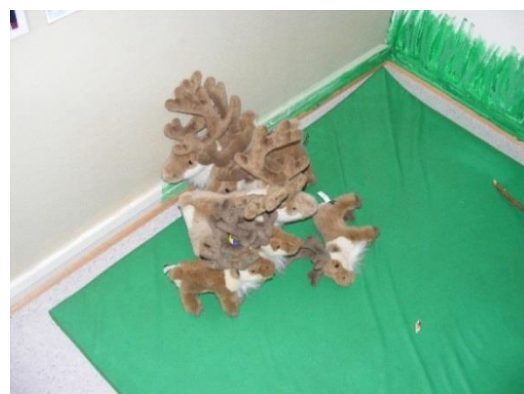
18. kép: Plüss rénszarvasok a játékhoz

A hegy lábánál fekvő, erdei környezetben található barnehage-ban a gyermekek a mindennapokat kint és bent is töltik. A kint töltött idő mennyisége a benti idővel arányos. Az udvaron