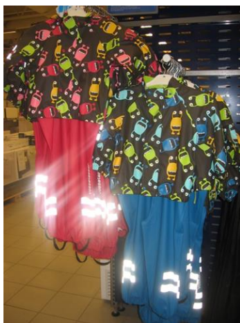
10. kép: Vízhatlan gyermek-overálok

A kinti héten reggelenként – a hideg időben napközben is – a gyermekek és a nevelők a hatszögletű sátorra emlékeztető kis gerendaházban gyűlnek össze (11. kép). Tűzet gyújtanak, a tűzgyújtásban a gyermekek is segédkeznek. Majd a tűz köré gyűlnek, körbe ülve beszélgetnek, mesét hallgatnak.