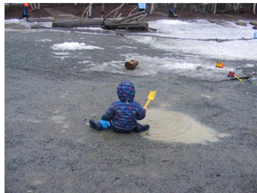
9. kép: Játék a vízzel

A természettel való közvetlen kapcsolat, a természeti jelenségek megfigyelése és átélése, az időjáráshoz való alkalmazkodás a mindennapok része. Ha a kinti, szabadlevegős héten esik az eső, a hó, ha fúj a szél és hideg az idő, mínuszok vannak, a csoport akkor is kint van az udvaron. A norvég filozófia szerint, nincs rossz idő csupán nem megfelelő az öltözet. Ha a gyermekek ruházata, amely vízhatlan ugyan, mégis átázna, nem gond, átöltöznek, és mennek vissza a többiekhez. A szülőknek több váltás, a barnehage által előírt, minden szempontból vízhatlan öltözetet, overálokat, gyapjú kesztyűket, egy ujjast, öt ujjast, csizmát, gumicsizmát, sapkákat kell beszerezniük és bevinniük a gyermekeik az óvodába (10. kép). A megfelelő öltöztetés beszerzése nem olcsó, de mindenki számára kötelező.