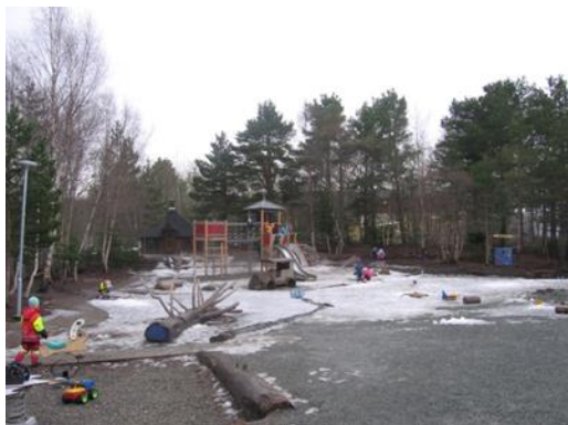
8. kép: A barnehage udvara