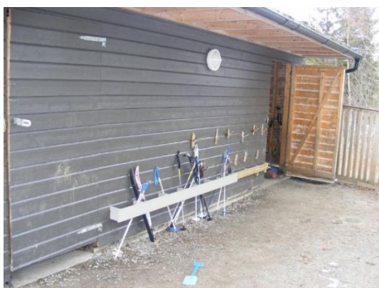
19. kép: A gyermekek sífutó felszerelése és tárolóhelye

Minden gyermeknek van sífutó léce az óvodában, megfelelő túrafelszerelése, hátizsákja. A gyermekcsoport délelőttként a felszerelésével felmegy a hegyre, és a biztonságosan kialakított sífutó pályán a nevelőkkel együtt élvezik a hó és a sífutás örömeit. A nevelők a hátizsájkjukban minden egyéb, a kint tartózkodáshoz szükséges kelléket magukkal visznek, polifomot amire a hóban le lehet ülni, néhány takarót a hideg ellen. Kint tartózkodnak kora délutánig, az otthonról hozott szendvicseket is ott, a hegyen fogyasztják el az ebédidőben.