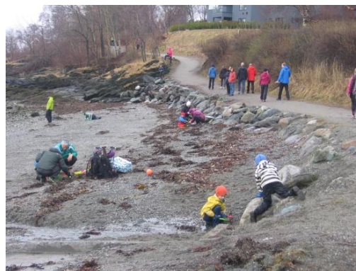
7. kép: Kirándulók a tengerparton – aktív kikapcsolódás a gyerekekkel

Tanulmányutunk legfőbb célja a szakmai tájékozódás, tapasztalatszerzés volt. Utunk előtt ugyan megneveztünk területeket, azonban jó volt látni, hogy az egyes szakmai területek milyen komplex módon csatlakoznak azokban az intézményekben (bölcsődékben, óvodákban, iskolában és a pedagógus képzés egy területén, a kisgyermeknevelő képzésben), ahol szakmai konzultációt, tapasztalatszerzést élhettünk meg. Fontos volt számunkra az is, hogy a norvég kollégák is érdeklődtek a magyar nevelésügy mindennapjairól, velünk együtt keresték a közös vonásokat és biztattak a látottak saját nevelési és tanítási rendszerünkbe illesztésére. Kapcsolatunk alapja a hallgatói tanulmánycsere is, ősztől két trondheimi diák gyakorol majd a mi intézményeinkben és tanul nálunk, velünk a karunkon.