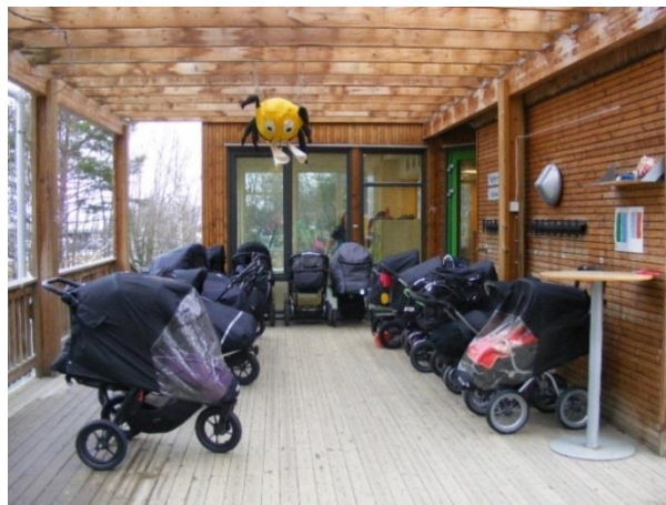
12. kép: Jól felszerelt babakocsik a teraszon

A második általunk felkeresett barnehage, igazi unikum volt a számunkra. Az intézményben minden évszakban, időjárástól függetlenül egész nap kint vannak a gyermekek a szabadlevegőn. A óvoda maga az erdei környezetben található nagy udvar és néhány kiszolgáló helység. A barnehage egyik végében található egy ponyvával borított sátor, ami a hideg ellen nyújt védelmet napközben a gyermekeknek és a felnőtteknek igény szerint. A sátor közepén egy zárt kályha adja a meleget, amely ez esetben is körbeülhető. A sátorba betérve és melegedve a gyermekek nap, mint nap megtapasztalják a tűz jelentőségét az ember életében. De a melegedésnek, beszélgetésnek és mesének a helye a szabadban is megtalálható. A tűzrakás és tűzgyújtás ceremóniája ebben az intézményben is mindennapos, és a tevékenységben a kicsik itt is aktív segítők. Amikor a tűz már lobog együtt a rénszarvasbőrökre telepednek, esznek, beszélgetnek, mesét hallgatnak.