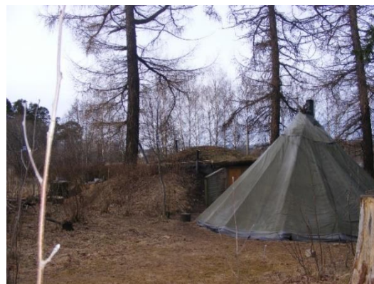
14. kép: Ponyvával borított sátor

Az erdei „játsszótér” sok lehetőséget kínál az alapvetően kíváncsi és érdeklődő gyermekek számára. A gyermekek a természetes környezetben kipróbálhatják önmagukat, egyedül, társal, társakkal játszhatnak, tevékenykedhetnek kedvük szerint. Itt sem korlátozzák a gyermeki szabadságot, ki-ki azzal tesz-vesz, amivel kedve van. Kipróbálhat mindent, mindenhová felmászhatnak, bebújhatnak, de mindent saját maguknak kell kitapasztalniuk.