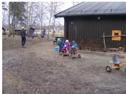
16. kép: Udvari játékeszközök

A harmadik barnehage-ban a számi hagyományok ápolását láthattuk. Ebbe az óvodába számi gyermekek is járnak. A számik a finnugor nyelvcsalád nagyon alacsony számú kisebbsége. Finnország, Norvégia, Svédország és Oroszország (Kola-félsziget) területén élnek körülbelül 80 000-en, a legtöbbben Norvégiában kb. 50 000 fő. Soha nem alkottak önálló államot. Nomád életmódot folytattak, a rideg állattartás mellett a közösség az állatokkal együtt vándorolt. Otthonuk, egy kerek vagy négyszögletes alapú, könnyen felállítható sátor volt, amelynek az alapját ágak és rénszarvasprémek alkotják. A sátor közepén nyílt tűzhely áll, amely fölött lógott a bogrács. Fő tevékenységük a rénszarvas tenyésztés volt és ma is az.