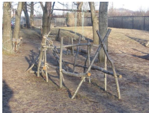
5. kép: Projekt munka – hallgatók féléves játszótér tervezési feladata

A merészség, a más gondolkodásmód a következő fotók történetének elmondása kapcsán is kérdéseket vehet fel. Az óvodai csoportszobában láttunk érdeklődő gyermekeket, akik épp a naposcsibék táplálkozását, tollászkodását nézegették. A kicsibék egy polcon voltak a melegítő infralámpa alatt. A polc előtt pedig egy kis lépcső segítette a gyerekeket a jobb megfigyelésben, hogy egy szinten lehessenek a látnivalóval. Az óvónőtől megtudtuk, hogy a csibék ott, az óvodái keltetőben keltek ki – azt is láthatjuk, s az élmény olyan friss volt, hogy a tojás is ott volt még a pulton. Csak melléleg jegyezzük meg, hogy mindez a használatban lévő mikrohullámú sütő mellett, a gyermekek eszközeit tisztító mosogatógéptől 1 méterre. A magyar óvodákban ez is elképzelhetetlen lenne. Igaz, így gyermekeink közül csak páran láthatnak tojásból kikelő kicsibét.