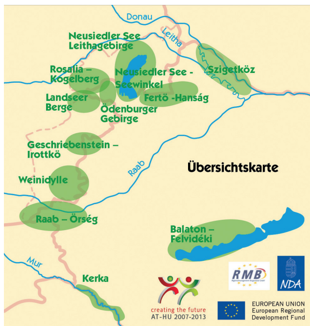
1. ábra: Nyugat-Dunántúl határterület turisztikai termékei

nem volt ipari fejlődés, mezőgazdasági nagyüzem, összekötő gyorsforgalmi utak, így a táji és nyelvi, kulturális identitás megmaradt. A volt határszakasz most érett abba az életkorba, hogy az eddigi hátrányt előnnyé kovácsolja a határon átnyúló fenntartható turizmus által. (1. ábra)