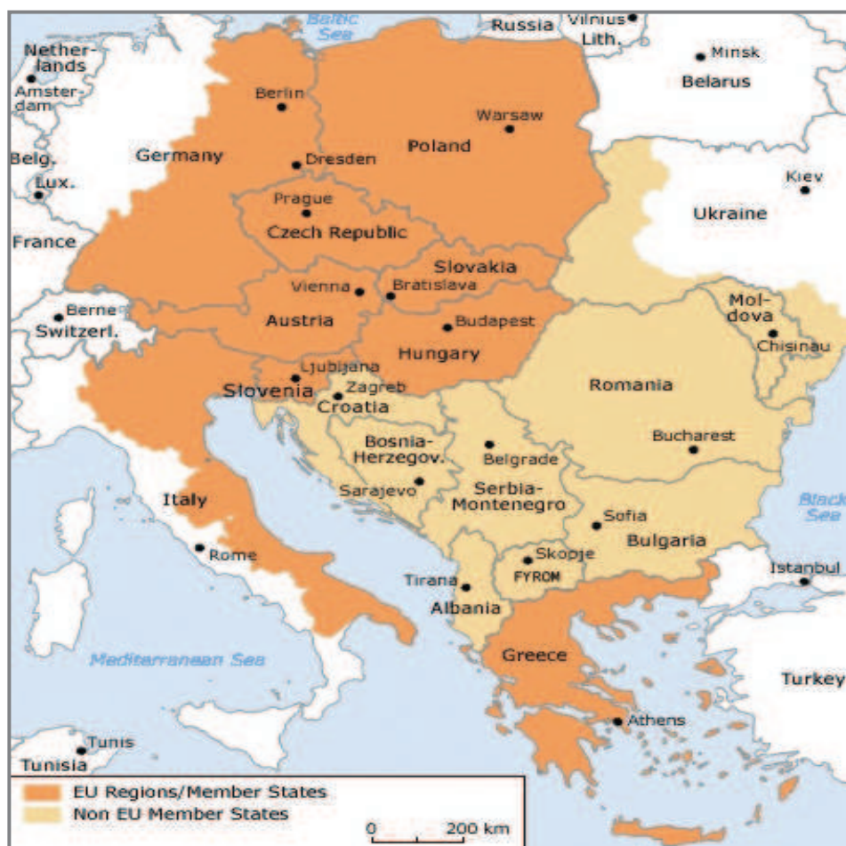
4. ábra: A CADSES országok

Ausztriát, így Alsó-Ausztriát is érinti az INTERREG IIIB Alpenraum és az INTERREG IIIB CADSES program. Az Alpenraum térség az alpesi térséget, míg a CADSES nagyjából Közép-Európát foglalja magában, Lengyelországtól Görögországig, Auszriától Moldáviáig.