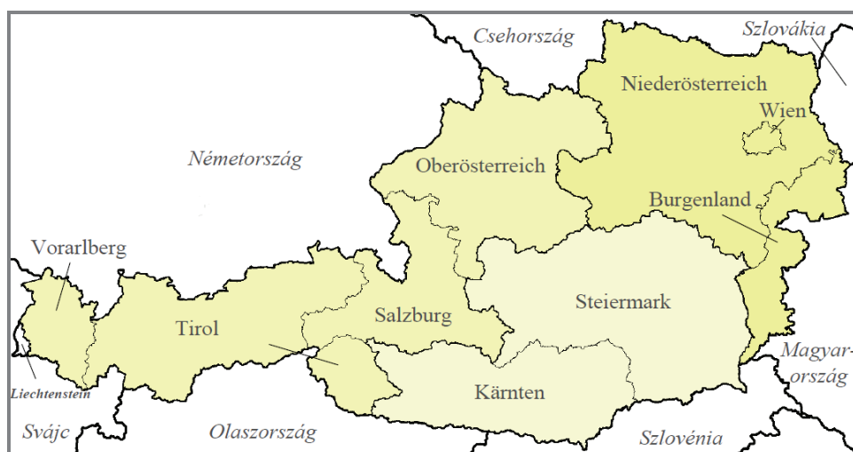
1. ábra: Ausztria NUTS II és NUTS III régiói

dalmi kapcsolatokban viszont annál jelentősebbek a különbségek. Alábbi országjellemzésünk Ausztria NUTS II szintű besorolását követi.